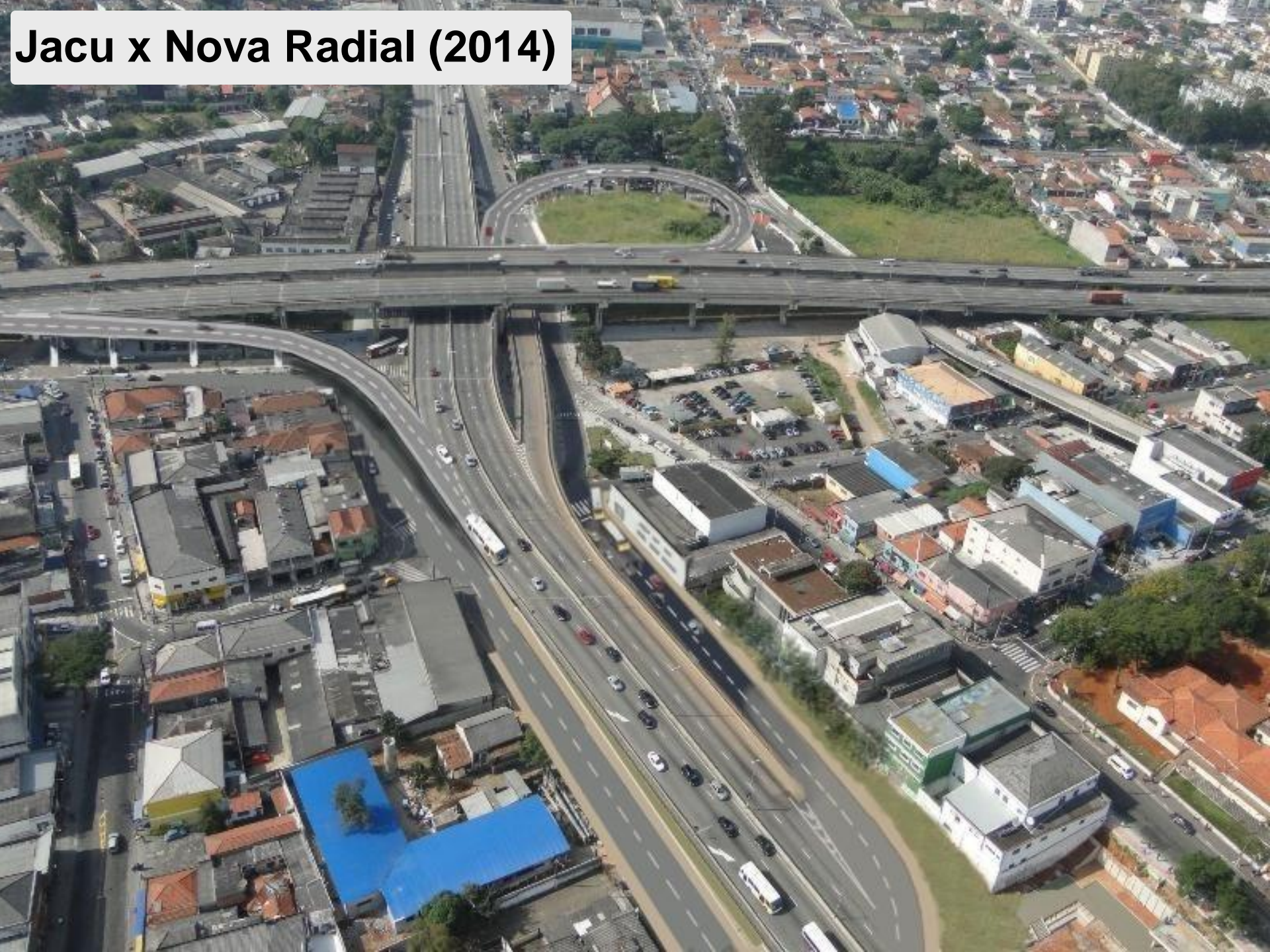
Jacu x Nova Radial (2014)