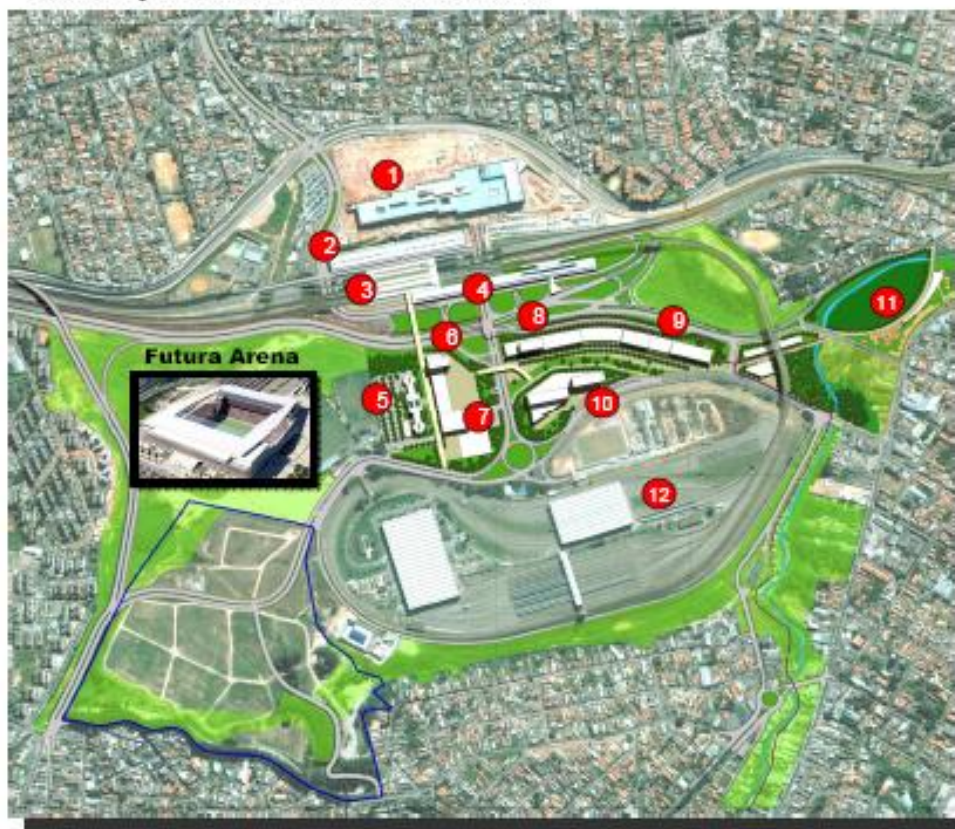
Localização do novo Estádio na Zona Leste